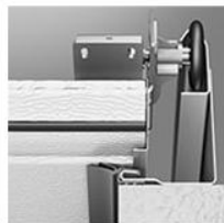
Двухлепестковый уплотнитель EPDM не впитывает влагу, сохраняет эластичность при низких температурах