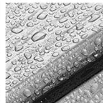
Долговечное покрытие панелей ПУР-ПА устойчиво к механическим повреждениям, перепадам температур и атмосферным осадкам