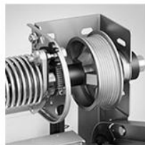
Безопасность эксплуатации в стандартном комплекте: защита от защемления пальцев, защита от падения полотна при поломке пружины, защита от зацепа и пореза