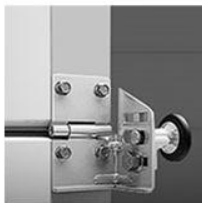
Нержавеющая фурнитура в стандартном комплекте (без наценки)